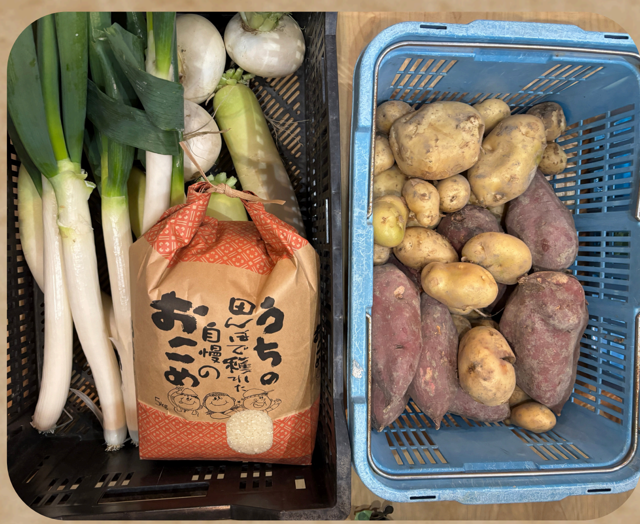
使用した規格外野菜