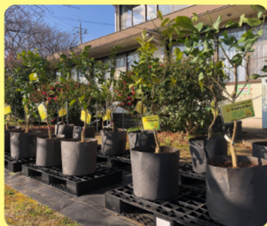
山田まちづくりセンターのレモン