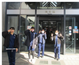
草津市役所に 行きました