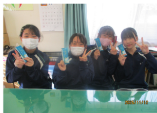
やまだメロンの 「凍らせてシャーベット」