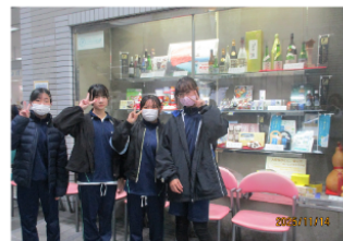
市役所内の観光物産ショーケース 内にシャーベット発見！