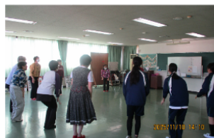
フォークダンスを 体験しました♪