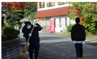
まちづくりセンター周辺の 落ち葉の掃除をしました