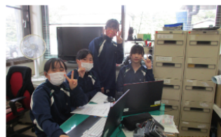
パソコンでホームページ、 公式LINEの配信をしました