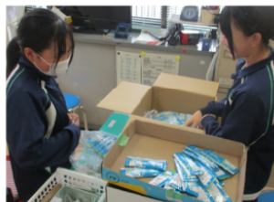
シャーベットの在庫確認や ラッピングをしました