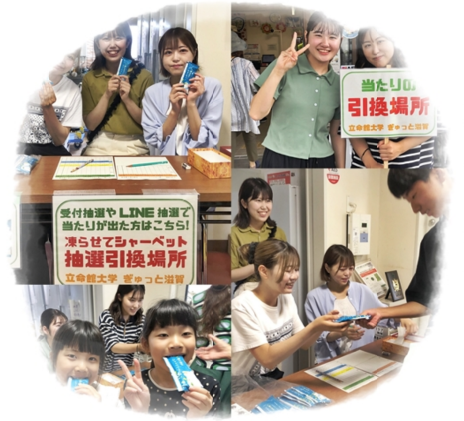
立命館大学「ぎゅっと滋賀」 抽選当選者にシャーベット配布！