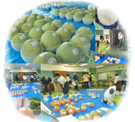
集会室にずらりと並んだメロン がすぐに完売しました！