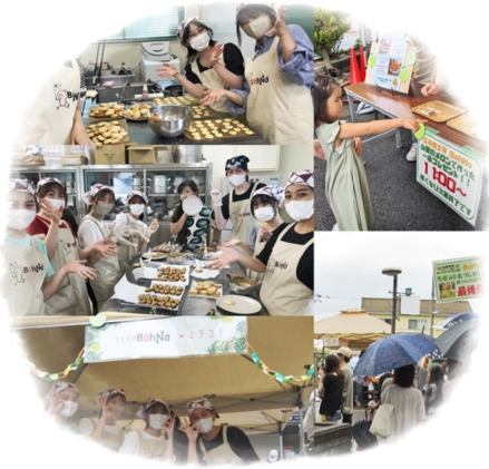
立命館大学「BohNo」 メロンクッキーとラスクの提供！