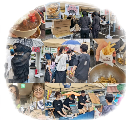
山田学区の地域のお店が出店！ 和気あいあいと楽しそうでした！