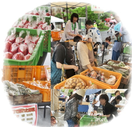
地元野菜販売！夏野菜や珍しいジャ ガイモがずらりと並びました！