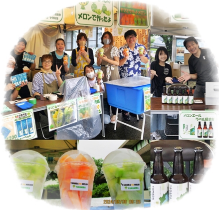
ヤマミラ カットメロン販売 近江麦酒 メロンエール販売