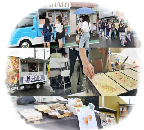
地域のお店やキッチンカーが出店！ 山田のメロンとパンナコッタも登場！