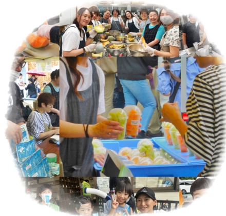
ヤマミラメンバーが朝早くから 136個のメロンをカット！